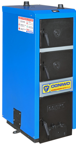
Kocioł S6WC Classic