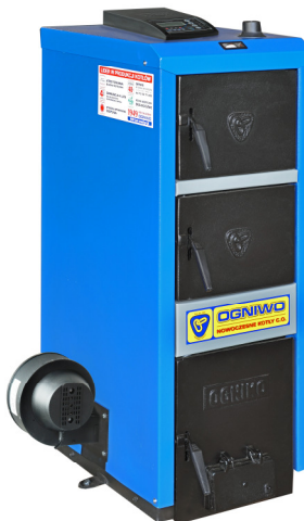
Kocioł S6WC Classic z zespołem napowietrzania (zespół napowietrzania nie wchodzi w zakres dostawy kotła)